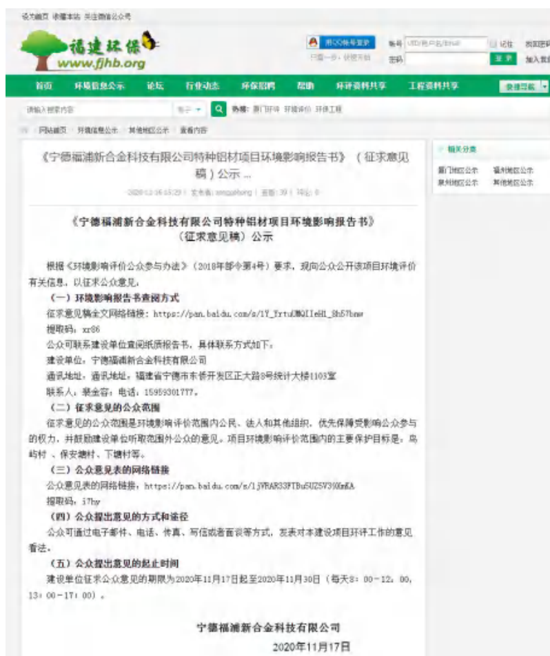
图 3-1 征求意见稿网络公示

本次征求意见稿报告公开在项目所在地公众易于接触的闽东日报公开，在 2020 年 11 月 17 日-11 月 30 日（10 个工作日）公开信息两次，公开日期分别为 2020 年 11 月 17 日和 11 月 20 日。