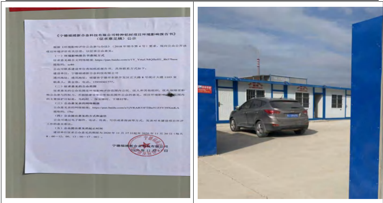
图 3-7 征求意见稿张贴公示内容 (宁德福浦项目部)