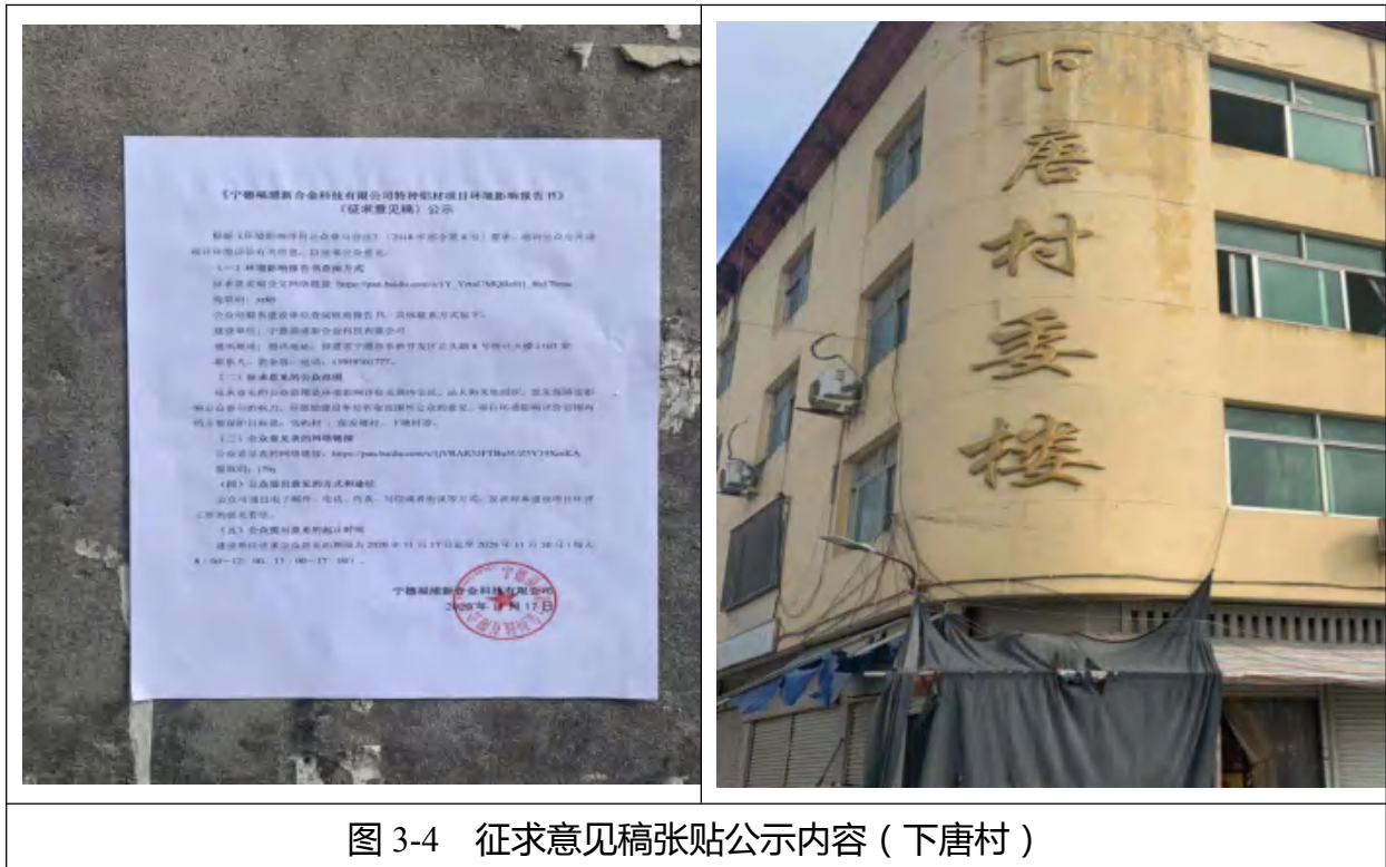
图 3-4 征求意见稿张贴公示内容（下唐村）

本次征求意见稿报告公开在鸟屿村、保安塘村、下塘村等处张贴公告。公开时间为 2020 年 11 月 17 日至 11 月 30 日（10 个工作日）。符合《环境影响评价公众参与办法》要求。