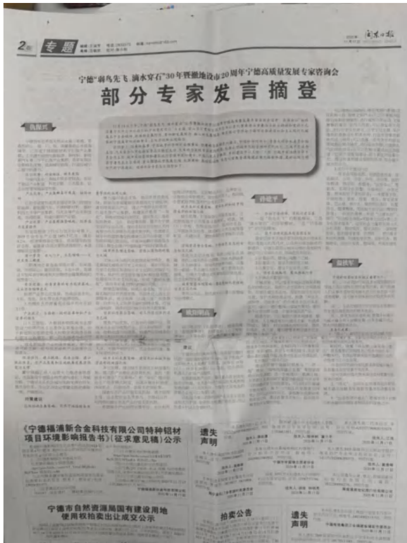
宁德福浦新合金科技有限公司特种铝材项目环境影响评价公众参与说明