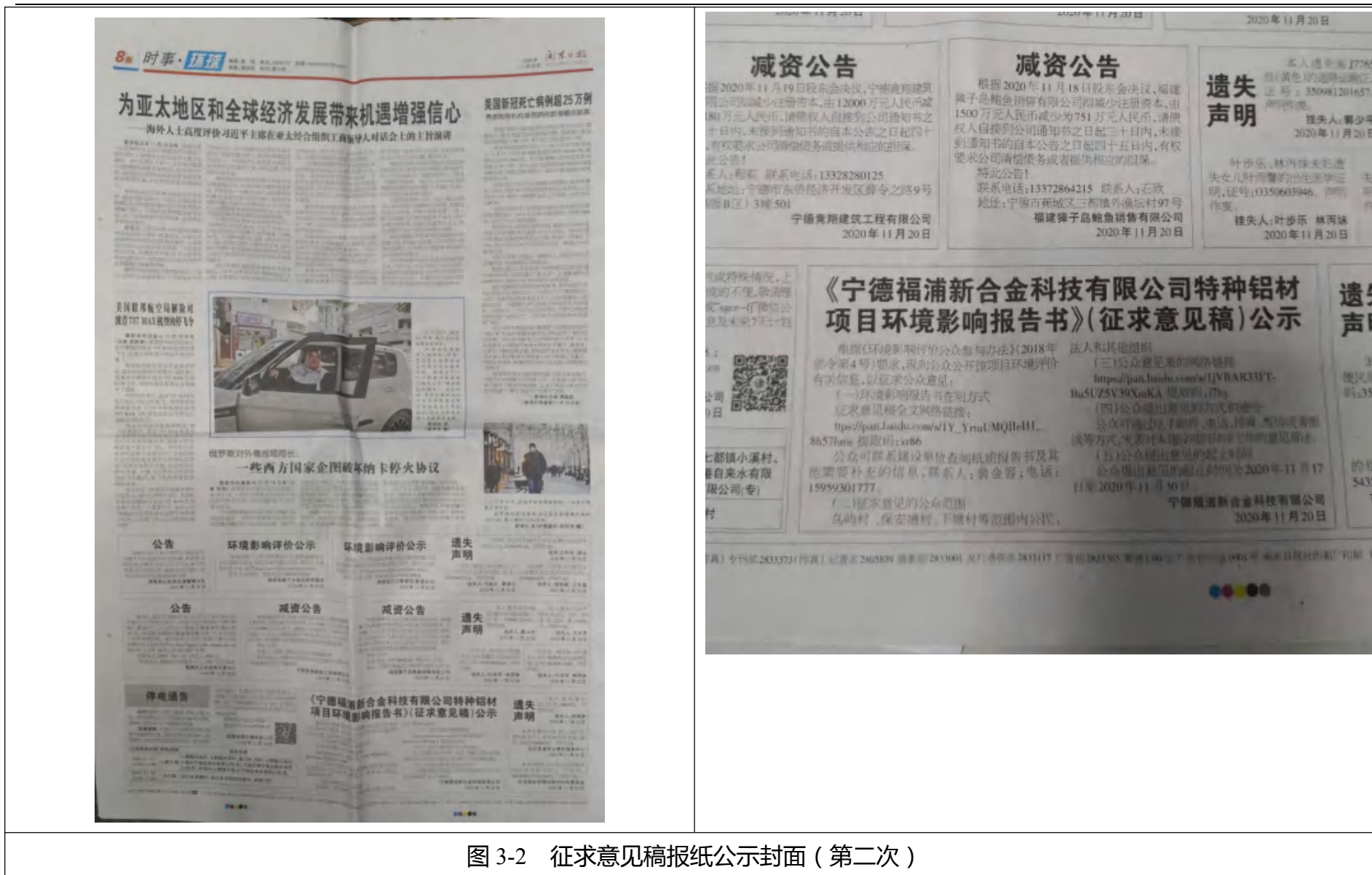
图 3-2 征求意见稿报纸公示封面（第二次）