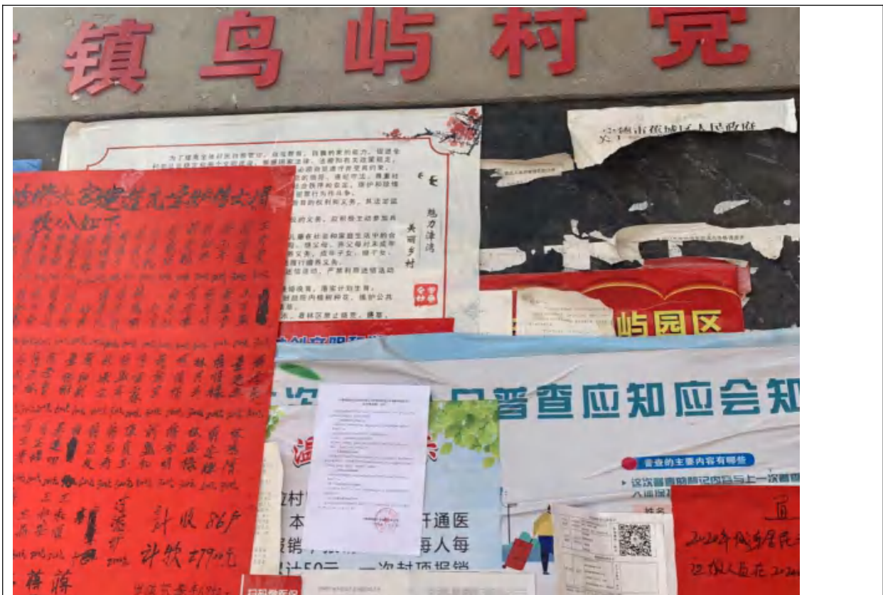
图 3-6 征求意见稿张贴公示内容（鸟屿村）