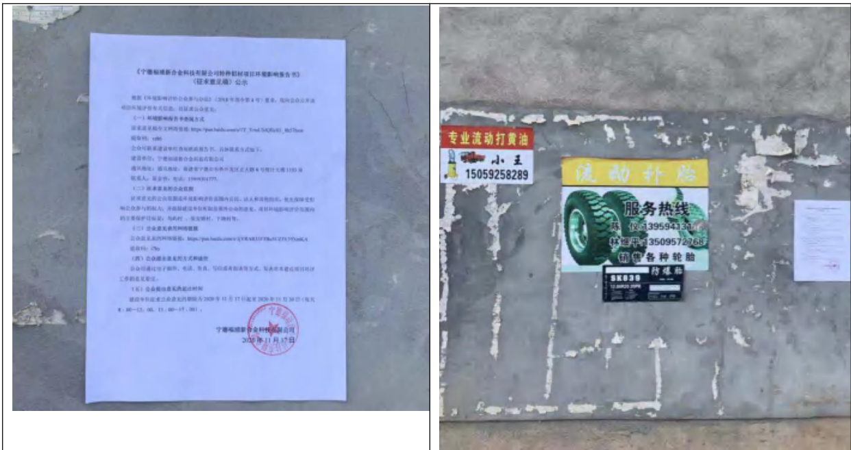
图 3-5 征求意见稿张贴公示内容（保安塘村）