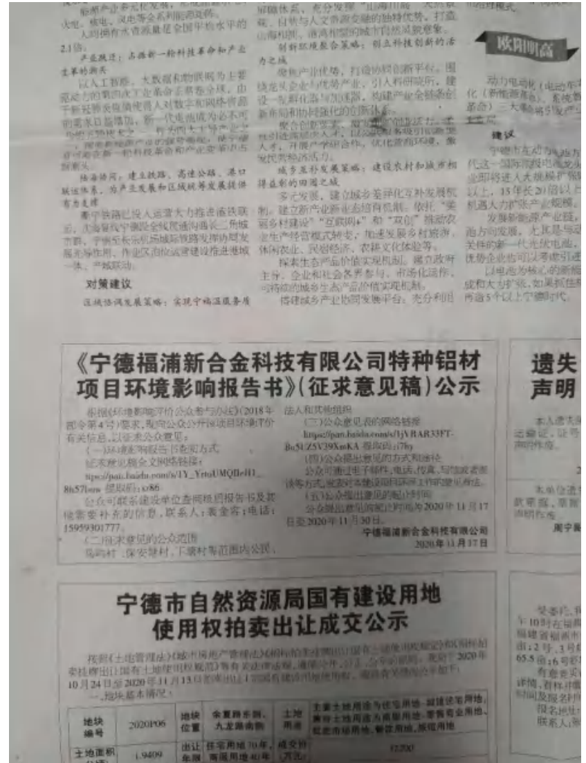
图 3-2 征求意见稿报纸公示封面（第一次）